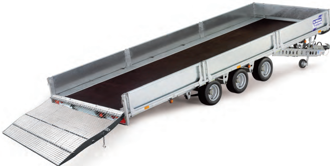
TB4621-302 ausgestattet mit abnehmbarer Laderampe und Radstoppnern